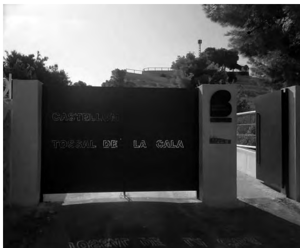
FIGURA 7. Entrada al Tossal de la Cala (Benidorm, Alacant) (2020).