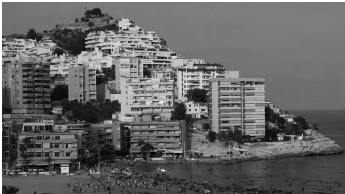
FIGURA 5. El Tossal de la Cala des del sud (Benidorm, Alacant) (2005).