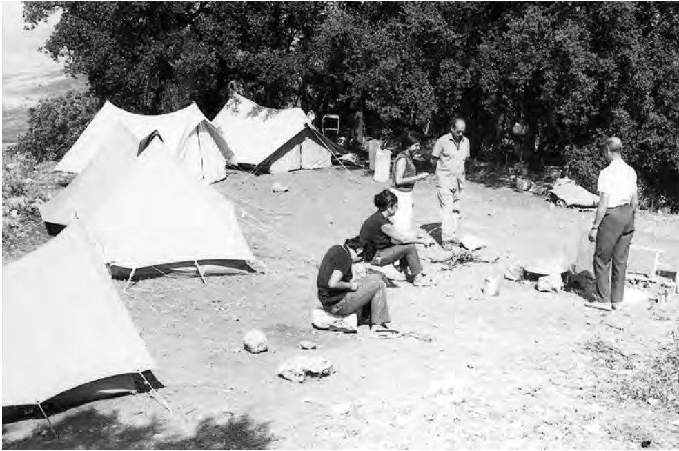
FIGURA 1. Campament de les excavacions de La Serreta (Alcoi-Cocentaina-Penàguila, Alacant) (1968).