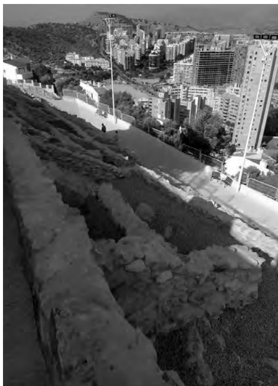
FIGURA 6. Restes consolidades del Tossal de la Cala (Benidorm, Alacant) (2020).