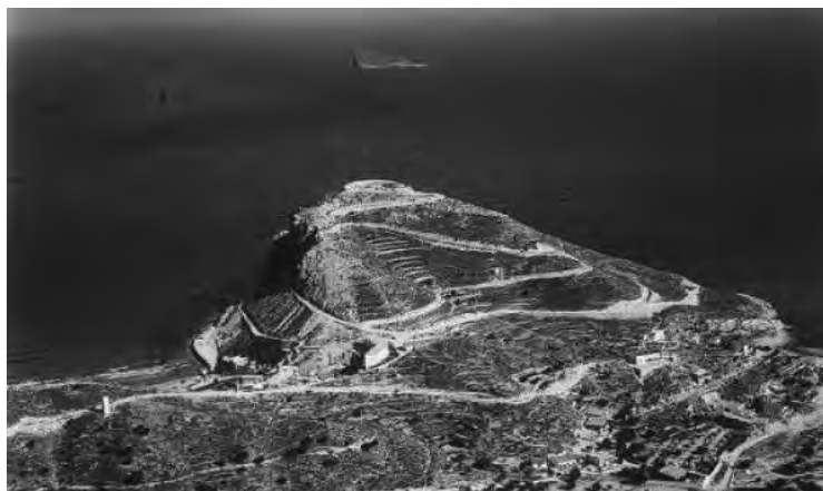
FIGURA 4. El Tossal de la Cala (Benidorm, Alacant) (anys cinquanta) ( https://benidorm.org/fondos-feder/sites/default/files/styles/contenido_completo_art_culo/public/noticias/tossal.jpg?itok=TjVtxJeS ).